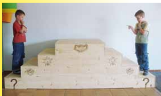
1. Was ist passiert?