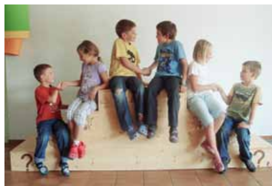
4. Frieden schliessen

Unter Anleitung der Lehrpersonen werden nun die gelernten Methoden weiter eingeübt und anlässlich der «Tage der offenen Schulen» im März 2012 den Eltern präsentiert.