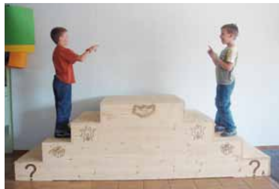
2. Was wünsche ich mir?