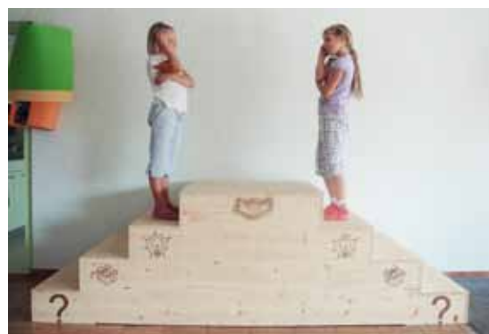
3. Lösung suchen, mit der alle einverstanden sind.